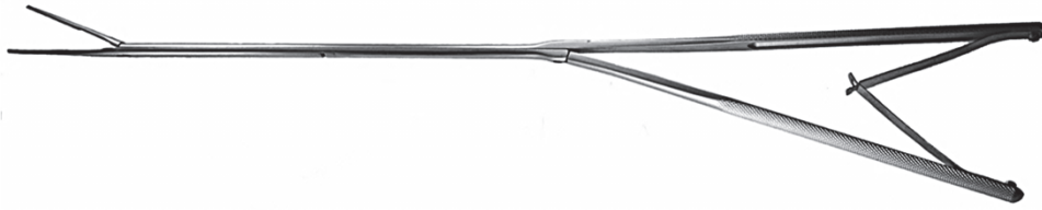
E2005.11B 胸腔鏡 腹腔鏡、食道手術