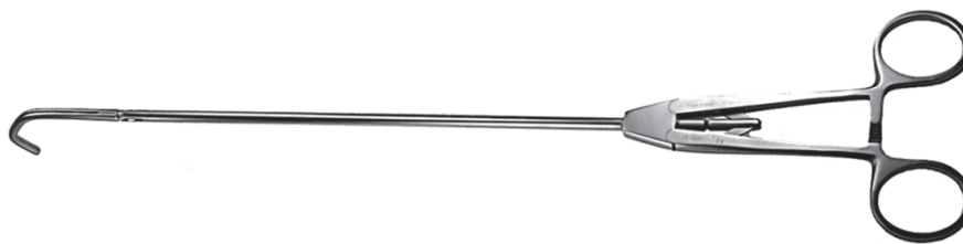
把持面2×3ドベーキ サテンスキー型