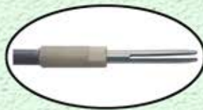
ハンドピース接続部