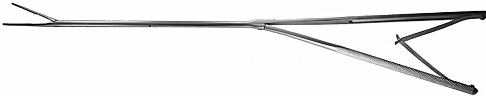
E2005.11B 胸腔鏡 腹腔鏡、食道手術