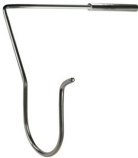
NFO1L A : 210mm B : 5mm C : 64mm