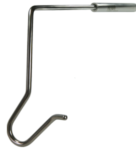
NFO1S A : 185mm B : 5mm C : 28mm