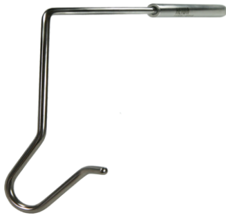
NFO1M A : 200mm B : 5mm C : 40mm