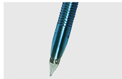
オプティックタイプ