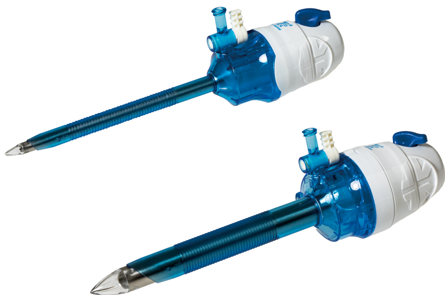
ブレードレスタイプの単回使用トロカールスリーブ