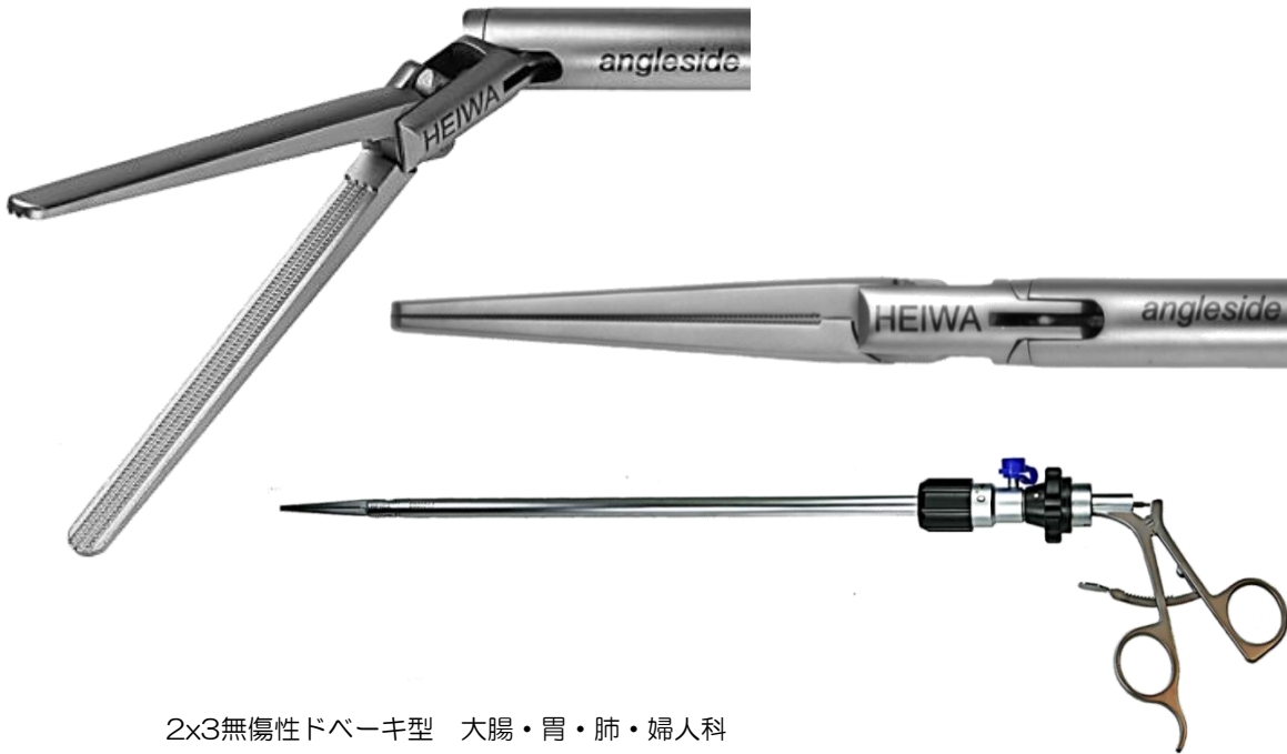
2x3無傷性ドベーキ型 大腸・胃・肺・婦人科