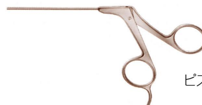
ピストル型ハンドル