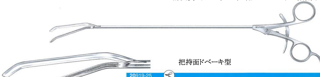
把持面ドベーキ型